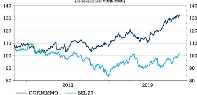
Cofinimmo versus BEL20 (herkend naar COFINIMMO)