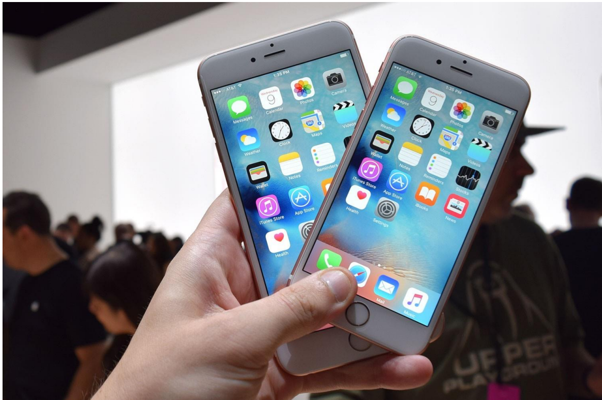
Figuur 1 Apple leunt zwaar op de iPhone

Sinds enkele jaren leeft onder beleggers en Applewatchers de prangende vraag of Apple zijn groei wel kan vasthouden. Het bedrijf is immers al uitgegroeid tot een moloch. Dan moet de groei wel afvlakken. Dat is een wetmatigheid. Beleggers zijn dan ook veel minder geïnteresseerd in de behaalde resultaten als wel in de vooruitzichten die het bedrijf presenteert. In dat opzicht week de presentatie over het vierde kwartaal van het gebroken boekjaar 2015 niet af van eerdere presentaties.