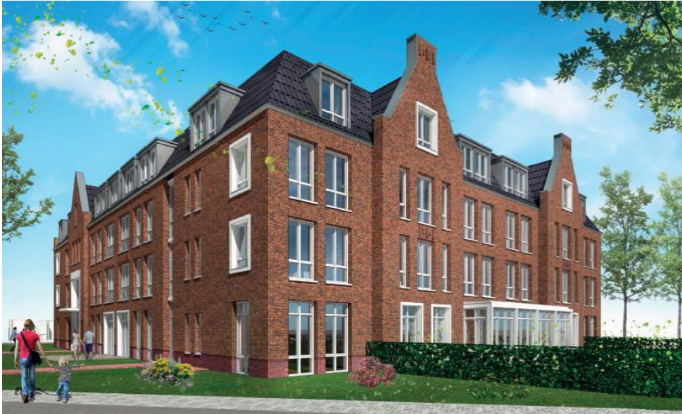
Het Gouden Hart Harderwijk (tekening) – Harderwijk

Aedifica heeft een overeenkomst gesloten voor de bouw van een site van huisvesting voor senioren in Nederland.