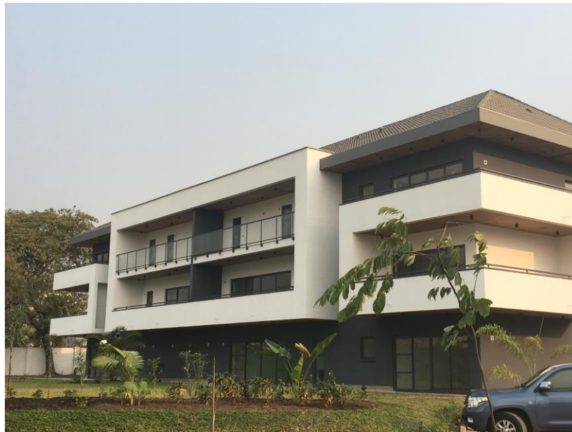
Appartementsgebouw van het project "Bois Nobles" afgewerkt.