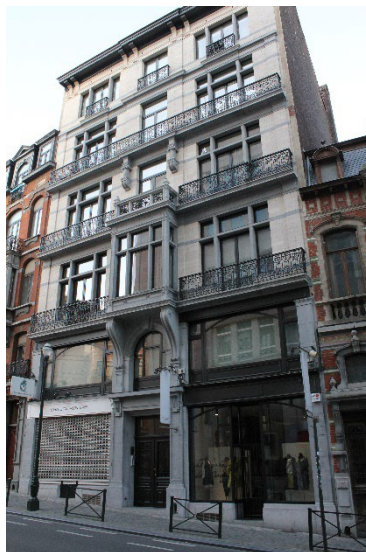
Lebeau – Grote Zavel – Brussel