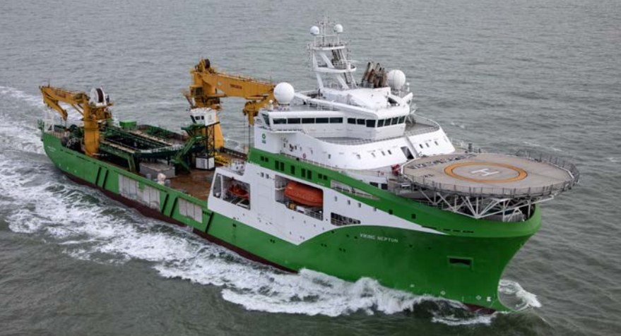
DEME | Viking Neptun