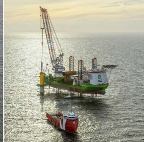
DEME | Innovation

DEME bevestigt haar vooruitzichten voor het jaar 2023, waarbij een hogere omzet verwacht wordt dan in 2022 en een EBITDA-marge vergelijkbaar met 2022. De investeringen zouden in 2023 ongeveer 500 miljoen euro bedragen.