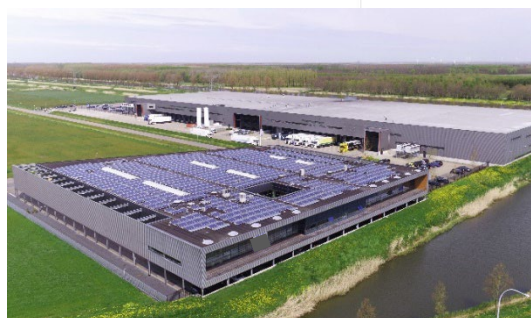
Afbeelding: ©MONTEA – Site Almere, Catharijne,

In 2013 kocht Montea reeds een eerste distributiecentrum van ca. 24.700 m 2 in Almere. Vandaag versterkt Montea haar portefeuille met de ondertekening van 2 sale & lease back transacties in Almere en in Zeewolde. De sites zijn uitstekend gelegen met een directe verbinding naar de autosnelwegen A6 (Amsterdam - Noord-Nederland) en A27 (Breda - Almere). De totale grondoppervlakte van deze sites bedraagt ca. 61.600 m 2 met ca. 37.650 m 2 logistieke ruimte en ca. 4.600 m 2 kantoorruimte en mezzanine.