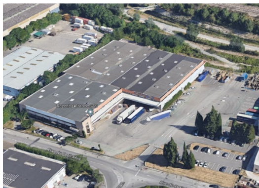
Site Avignon