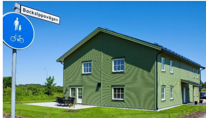
Bålinge Lövsta 9:19 – Uppsala

3 zorggebouwen in Uppsala worden geëxploiteerd door Frösunda Omsorg , een private speler met meer dan 30 jaar ervaring in de Zweedse zorgsector. De groep biedt ouderenzorg, gehandicaptenzorg en persoonlijke begeleiding aan meer dan 2.100 personen en exploiteert meer dan 100 zorggebouwen.