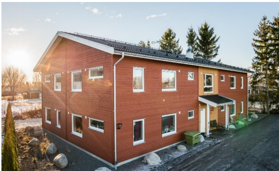
Bälinge Lövsta 10:140 – Uppsala

24 juni 2021 – na sluiting van de markten