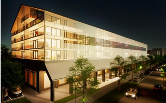
Oulu Siilotie K21 – Oulu (FI)

7 juli 2023 – na sluiting van de markten Onder embargo tot 17u40 CET