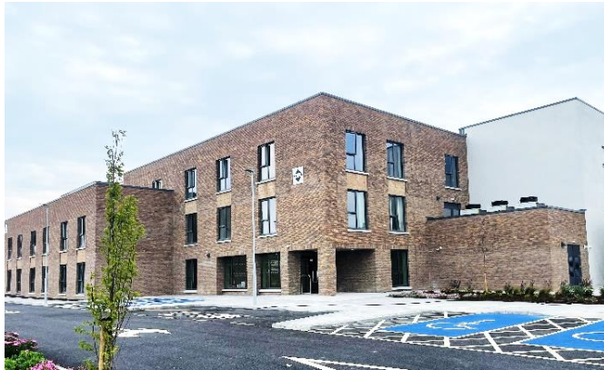
Kilbarry Nursing Home – Kilbarry (IE)