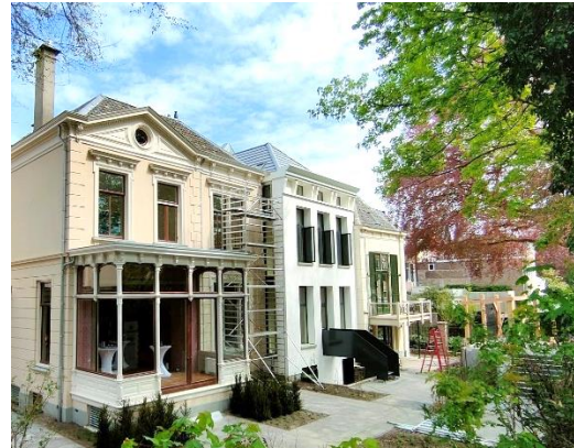
Residence Coestraete – Zwolle (NL)

In het tweede kwartaal van 2023 werden 9 ontwikkelingsprojecten uit Aedifica's investeringsprogramma opgeleverd in België, Nederland, Finland en Ierland voor een totaalbedrag van ca. 53,5 miljoen €, waarmee Aedifica's portefeuille werd uitgebreid met capaciteit voor 268 bewoners en 448 kinderen. Deze zorglocaties worden uitgebaat door een gediversifieerde pool van gevestigde en ervaren private en publieke exploitanten. De drie projecten in Finland zijn ontworpen en ontwikkeld door ons lokale Hoivatilat-team.