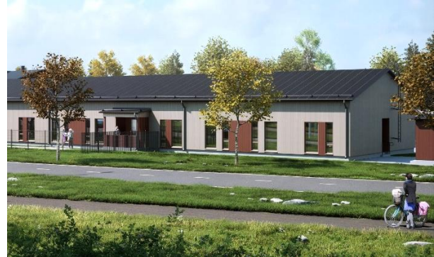
Rovaniemi Gardininkuja – Rovaniemi (FI)

Het Finse Hoivatilat-team ontwikkelt een woonzorgcentrum in Rovaniemi (64.500 inwoners). Rovaniemi Gardininkuja zal plaats bieden aan 30 ouderen met hoge zorgbehoeften. De bouwwerken zijn al begonnen en zullen naar verwachting in het eerste kwartaal van 2024 worden opgeleverd. Het gebouw zal worden uitgebaat door Suomen Kristilliset Hoivakodit. Deze gevestigde privé-exploitant baat al twee zorgcentra uit en heeft meer dan 20 jaar ervaring in de lokale ouderenzorgsector.