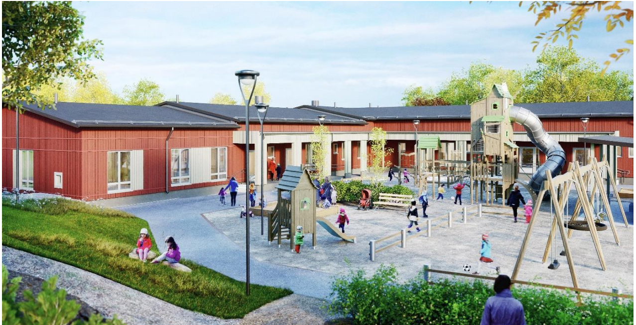
Espoo Palstalaisentie – Espoo (FI)