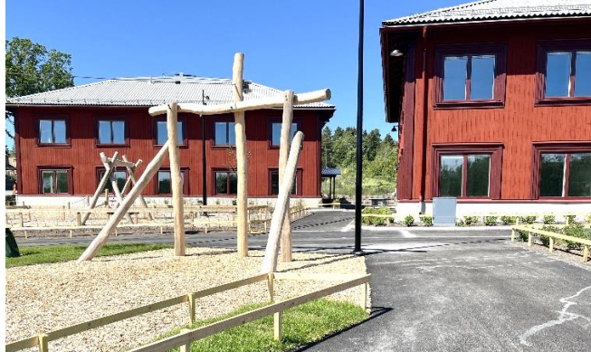
Nynäshamn Källberga – Nynäshamn (SE)

In het derde kwartaal van 2024 werden vijf projecten uit Aedifica's investeringsprogramma opgeleverd in het Verenigd Koninkrijk, Finland en Zweden voor een totaalbedrag van ca. 61,5 miljoen €. De projecten voegen capaciteit voor 202 bewoners en 644 kinderen toe aan de portefeuille van de Groep. De zorglocaties worden uitgebaat door een gediversifieerde pool van gevestigde en ervaren private en publieke en non-profit exploitanten.