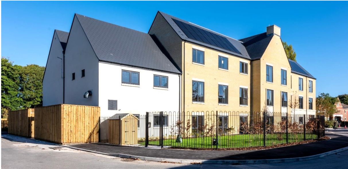
York Bluebeck Drive – York (UK)

10 oktober 2024 – na sluiting van de markten