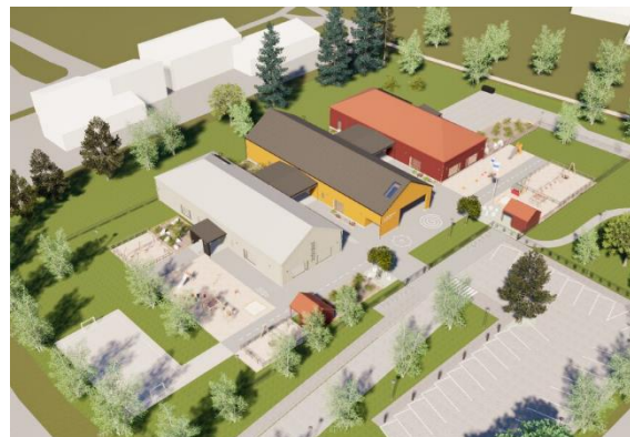
Kokkola Kruunupyntie – Kokkola (FI)