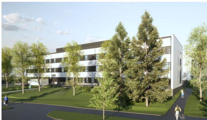
Jyväskylä Lahjajarjuntie – Jyväskylä (FI)