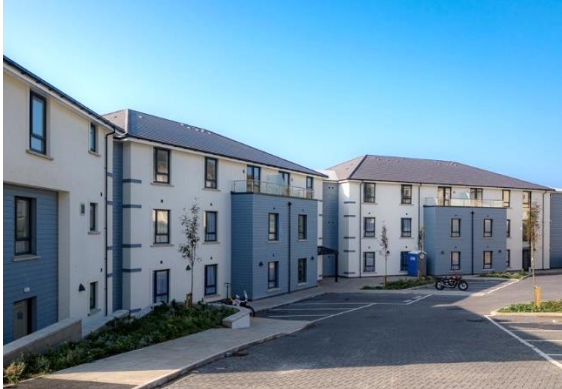
Spaldrick House – Port Erin (Isle of Man)