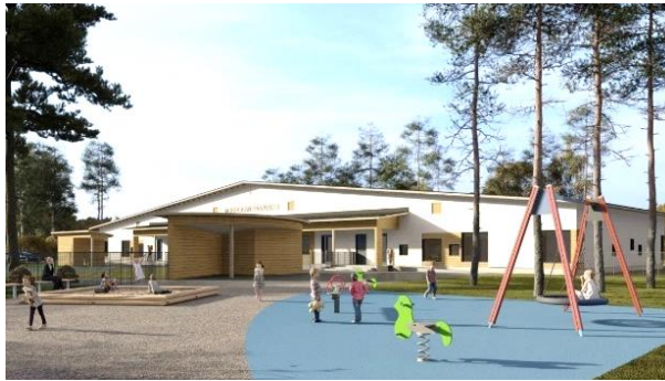
Rovaniemi Koulukaari – Rovaniemi (FI)

4 januari 2024 – na sluiting van de markten