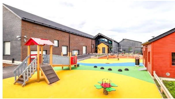
Oulu Mäntypellonpolku – Oulu (FI)