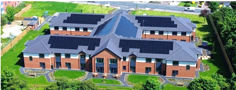
Copperfield Court – Broadstairs