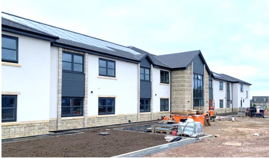
Somer Valley House – Midsomer Norton

9 september 2024 – vóór opening van de markten