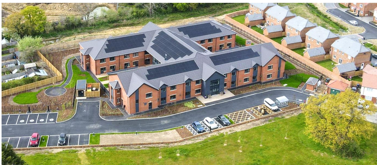
Furze Field Manor – Sayers Common

Aedifica investeert ca. 61,5 miljoen £ in de acquisitie van vier futureproof woonzorgcentra in het Verenigd Koninkrijk.