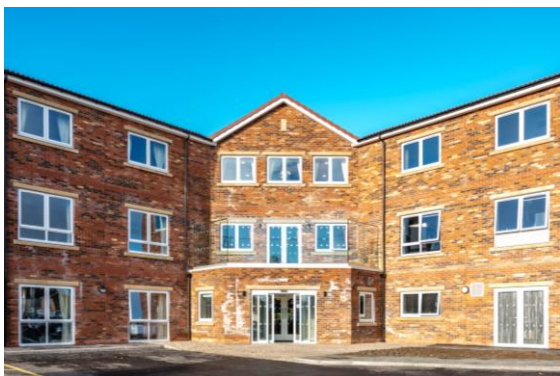
Ashfield Road in Sleaford, uitgebaat door Torwood Woonzorgcentrum voltooid in november 2023

Ingrid Daerden, CFO van Aedifica, stelt: “Vijf jaar na onze eerste investeringen is Aedifica stevig verankerd in het Verenigd Koninkrijk met een vastgoedportefeuille van meer dan 1 miljard € en een eigen lokaal team. Met onze status als UK REIT zetten we nu de volgende stap in onze langetermijnstrategie. Hierdoor zullen onze investeringen in het VK aantrekkelijker worden en zal de bijdrage van de kasstromen uit het VK aan het resultaat van de Groep verhogen.”