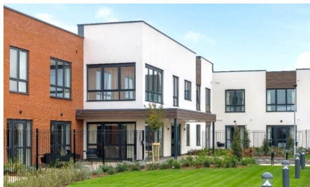
Chartwell Manor in Aylesbury, uitgebaat door MMCG Woonzorgcentrum voltooid in september 2022