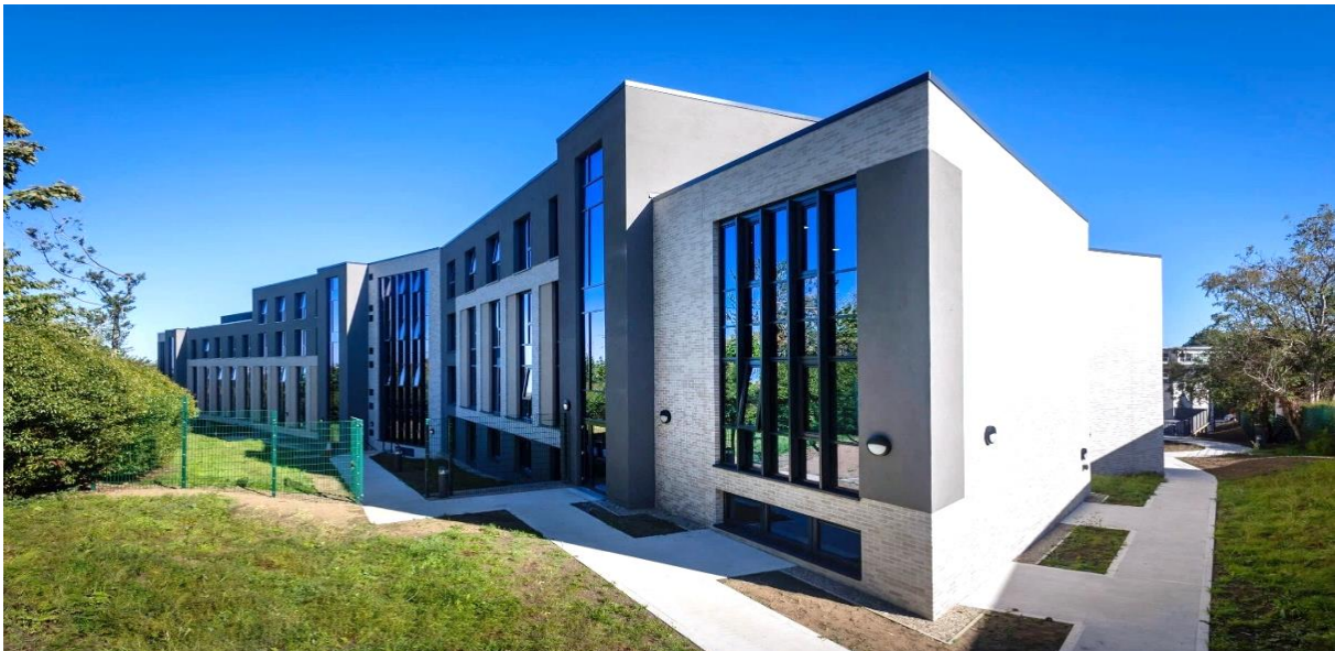
Dublin Stepside – Dublin (IE)

Stefaan Gielens, CEO van Aedifica, stelt: "In het vierde kwartaal van 2024 voltooidde Aedifica acht projecten uit haar investeringsprogramma voor een totaalbedrag van ca. 100 miljoen €. In totaal hebben we in het boekjaar 2024 31 projecten opgeleverd voor meer dan 296 miljoen €. Rekening houdend met deze opleveringen en de drie projecten die in het vierde kwartaal aan de pipeline zijn toegevoegd, bedraagt ons investeringsprogramma eind 2024 160 miljoen €, met een gemiddeld initieel rendement op basis van de kostprijs van meer dan 6%."