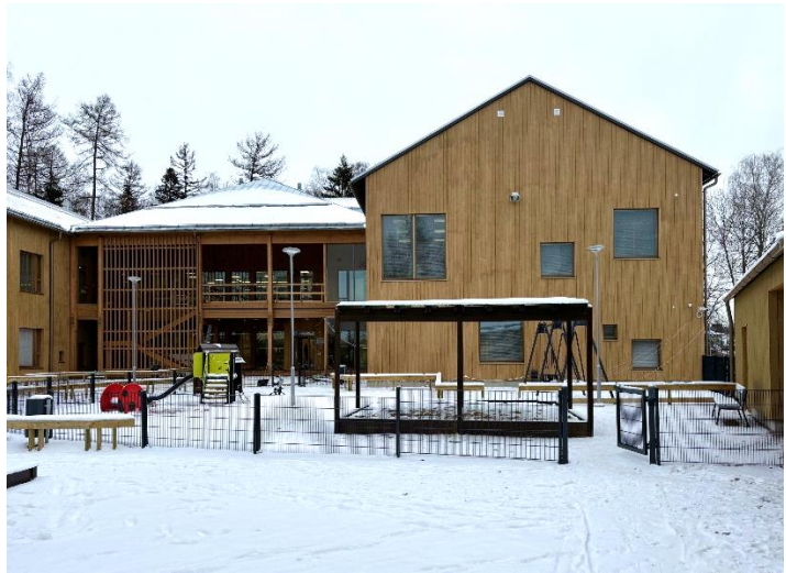
Helsinki Käräjätuvantie – Helsinki (FI)

In het vierde kwartaal van 2024 werden acht projecten uit Aedifica's investeringsprogramma opgeleverd in België, het Verenigd Koninkrijk, Finland en Ierland voor een totaalbedrag van ca. 100 miljoen €. De projecten voegen capaciteit voor 277 bewoners en 770 kinderen toe aan de portefeuille van de Groep. De zorglocaties worden uitgebaat door een gediversifieerde pool van gevestigde en ervaren private en publieke exploitanten.