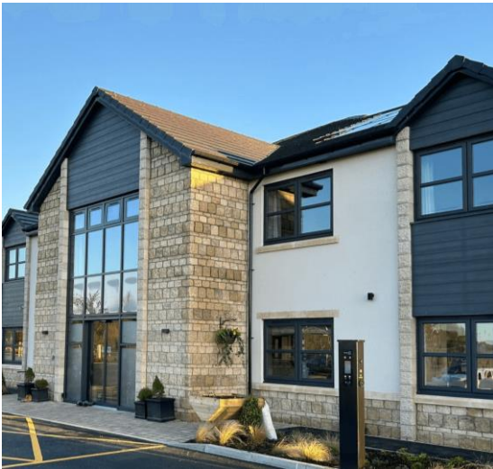
Somer Valley House – Midsomer Norton (UK)

14 januari 2025 – na sluiting van de markten