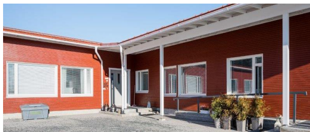
Kuopion Oiva – Kuopio

De sites worden verhuurd op basis van niet-opzegbare double net huurovereenkomsten met een WAULT 2 van 13 jaar. Het initiële brutohuurrendement bedraagt ca. 6%.