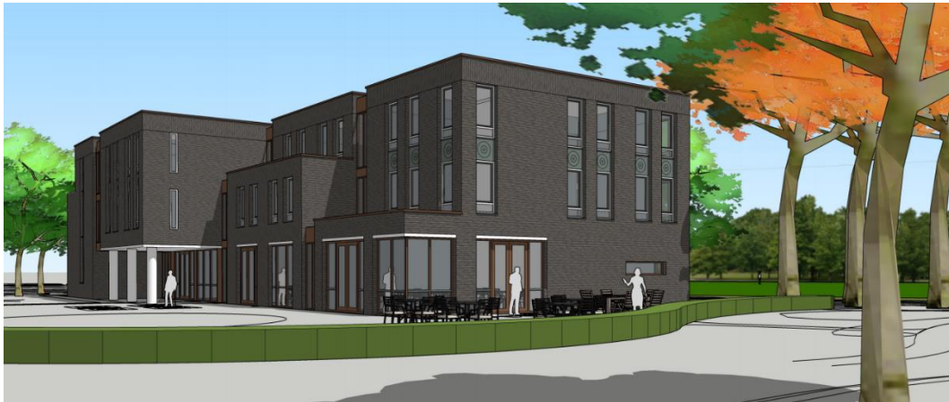
Het Gouden Hart Soest – Soest

10 december 2020 – na sluiting van de markten Onder embargo tot 17u40 CET