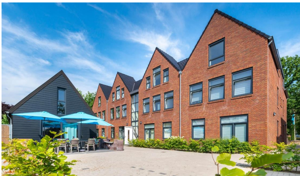
Zorghuis Hengelo – Hengelo

Aedifica en Korian, een toonaangevende Europese speler in de ouderenzorgsector, bundelen hun krachten in een joint venture om te investeren in de ontwikkeling van futureproof zorgvastgoed in Nederland dat door Korian wordt geëxploiteerd.