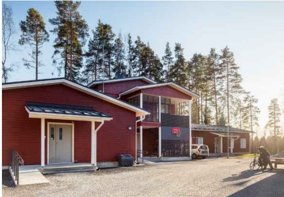
Nokian Luhtatie – Nokia

Aedifica investeert 26,5 miljoen € in een portefeuille van 7 Finse zorgvastgoedgebouwen die reeds in exploitatie zijn.