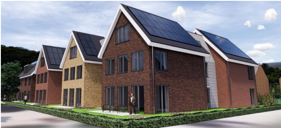
Het Gouden Hart Woudenberg – Woudenberg

10 december 2020 – na sluiting van de markten Onder embargo tot 17u40 CET