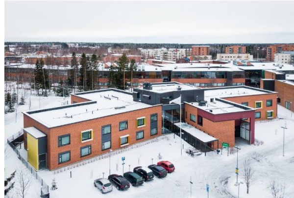
Oulun Villa Sulka – Oulu

Stefaan Gielens, CEO van Aedifica, stelt: “Aedifica is zeer verheugd dat Hoivatilat kort na de afronding van de kapitaalverhoging de Finse zorgvastgoedportefeuille verder uitbreidt met de acquisitie van 7 moderne zorglocaties die reeds in exploitatie zijn. We investeren ca. 26,5 miljoen € in 7 recente gebouwen die plaats bieden aan meer dan 170 ouderen, personen met een mentale handicap en jongeren met psychische problemen. De sites worden uitgebaat door 4 professionele private en non-profit exploitanten. Door de afronding van deze transactie, overschrijdt de Finse zorgvastgoedportefeuille de kaap van 600 miljoen €. Andere investeringen zullen nog volgen.”