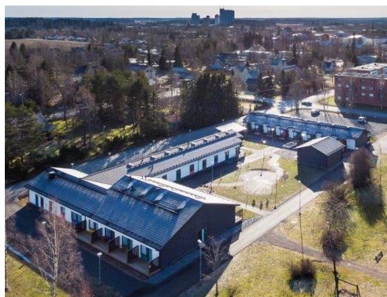
Loimaan Villa Inno – Loimaa