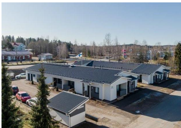
Nokian Luhtatie – Nokia

10 december 2020 – na sluiting van de markten Onder embargo tot 17u40 CET