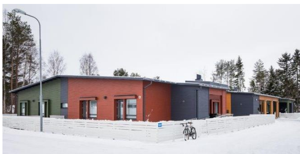
Oulun Maininki – Oulu

10 december 2020 – na sluiting van de markten Onder embargo tot 17u40 CET