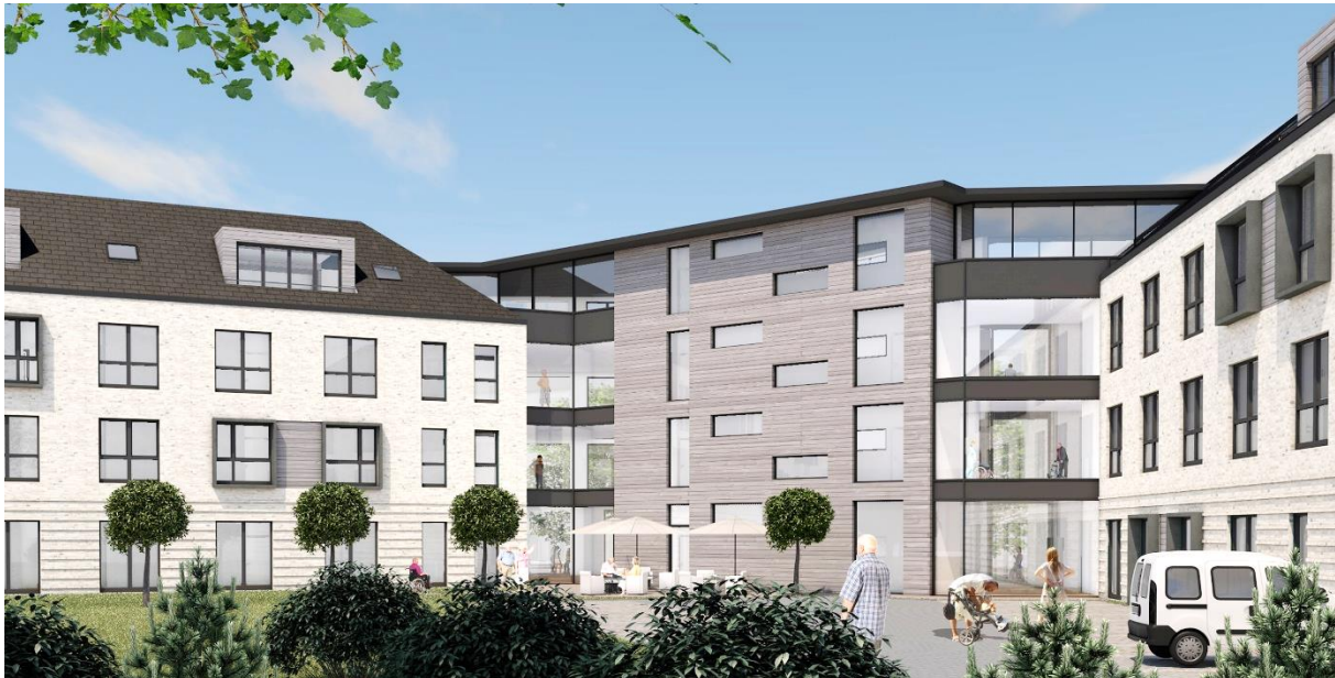
Project in Cuxhaven (Nedersaksen)

Op 16 december 2020 heeft Aedifica de grondposities verworven waarop de volgende vier zorgcampussen van de eerste raamovereenkomst met Specht Gruppe 1 zullen worden gebouwd.