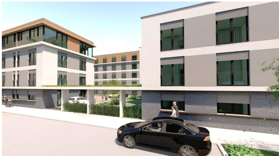
Project in Gera (Thüringen)

16 december 2020 – na sluiting van de markten Onder embargo tot 17u40 CET