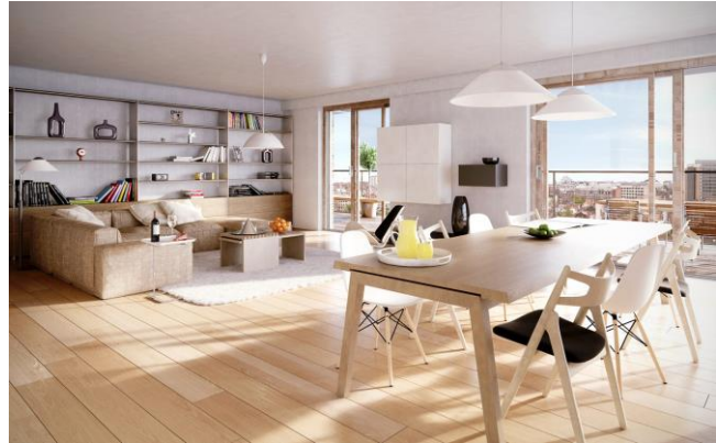
→ Livingstone I